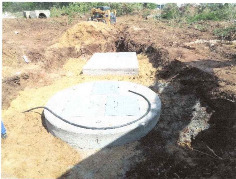
MOBA E20 átemelő és szerelvényakna