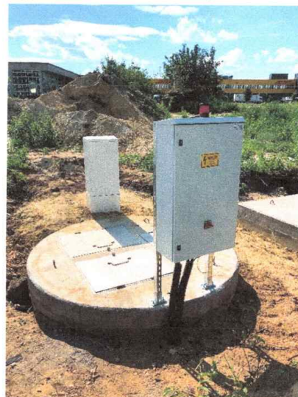
Flygt FGC400 vezérlőszekrény GSM/GPRS